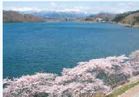
釜房ダム 分譲地から約6.5km