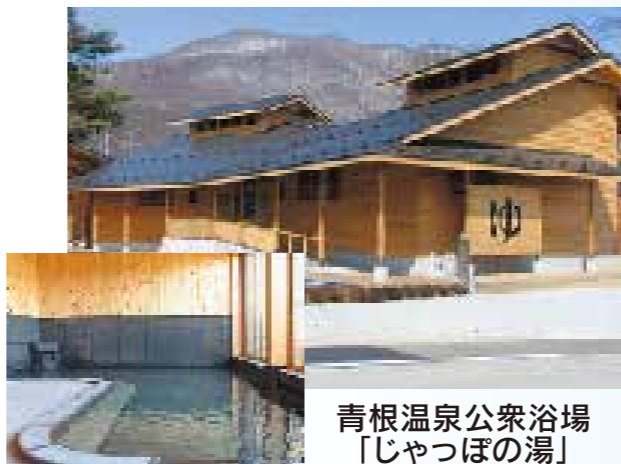
青根温泉公衆浴場「じゃっぼの湯」 分譲地から約20km

道路 幅員は6mで全面舗装されています。 給水施設 公営水道を各区画に設置しています。(水道加入金は別途必要になります。) 環境衛生 個別に合併処理浄化槽の設置が必要です。 各区画には、合併浄化槽からの排水を接続できる枡が設置されています。 合併浄化槽設置については、条件を満たせば、川崎町から補助金の交付が受けられます。 消防水利 団地内山口農村公園に、防火貯水槽(40㎡)が設置されています。 電気・電話 個別に引き込み願います。建柱されていますので、引き込みが容易です。 ガス 個別にプロパンガスです。 建ぺい率 70% 容積率 200%