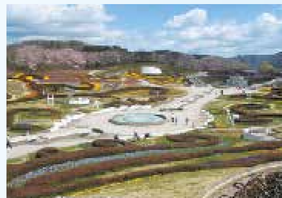
国営みちのく杜の湖畔公園 分譲地から約5.0km