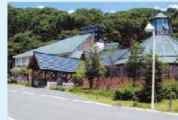
川崎町交流促進センター「るぼわかわさき」 分譲地から約20km